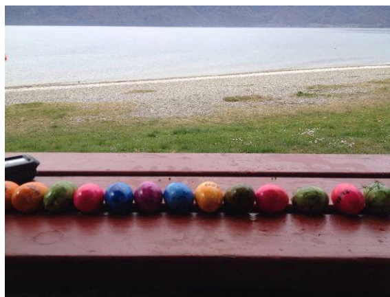
Die Farbgebung alle Eier entspricht „Versteckjahrgang 2016“

Obwohl die Einladung zum traditionellen Ostertauchen beim Schriftwart im Postausgang stecken blieb und die unüblich frühe Startzeit somit beinahe zu einer reinen Versteckveranstaltung der Taucherhasen wurde, folgten dennoch einige Taucher dem kurzfristigen Aufruf zum morgendlichen Eiersuchen und machten „fette Beute“.