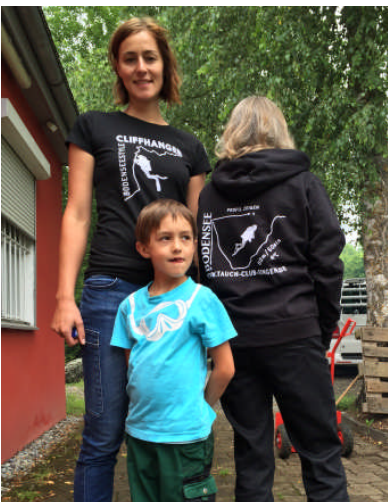
... neu Club-Shirts & Hoodies!

Um diesen Dank nochmals zu unterstreichen gab's zum Helfer-Shirt obendrauf noch ein kleines Helferfest. Der Wettergott war gnädig mit uns und gönnte uns eine perfekt getimte Regenpause für ein unbeschwertes Grillfest. Perfekter Übergang zur abendlichen Fußball Grillparty bei Marchello, aber das ist ein anderes Thema.