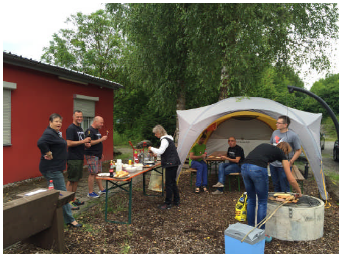
Grillen im „Planseestyle“ (Regenpause ist wenn gegrillt wird, bitte!)

Wer sich schon auf dem Stadtfest und auch den obigen Bildern über das neu uniformierte Auftreten wunderte....ja: die neuen hochwertigen T-Shirts (auch für den Nachwuchs!) & Hoodies sind ab sofort erhältlich. Am besten zu den üblichen Treffzeiten am Club Begutachten, Probetragen und mitnehmen. Einziger Wehrmutstropfen: sie müssen bezahlt werden (T-Shirt 22,- bzw. Kapuzenpulli 28,-€).