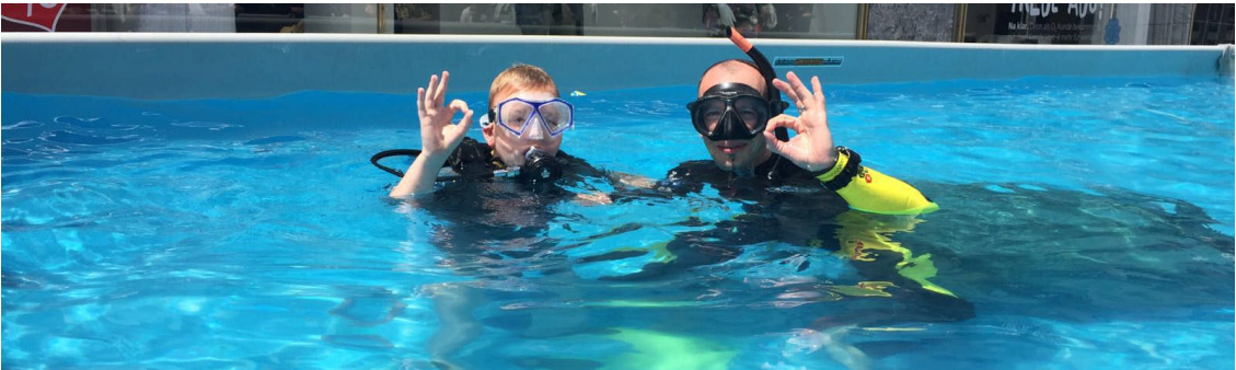
... Unterwasserkommunikation, Theorie Teil I

Wir können als Club stolz darauf sein, wie wir uns wieder präsentiert haben!